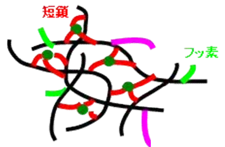
本技術の樹脂構造のイメージ

本技術では、プレポリマー中の短側鎖ヒドロキシル基に対する長側鎖ヒドロキシル基の含有比を小さくし、プレポリマーの主鎖同士を密に架橋しています。さらにプレポリマーはF側鎖を有します。これにより、水接触角を従来の70°程度から102°程度までに向上させることができます。さらに、耐熱性を従来の100°C程度から240°C程度にまで向上させることができます。